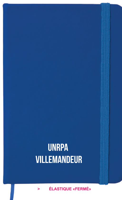
> ÉLASTIQUE «FERMÉ»